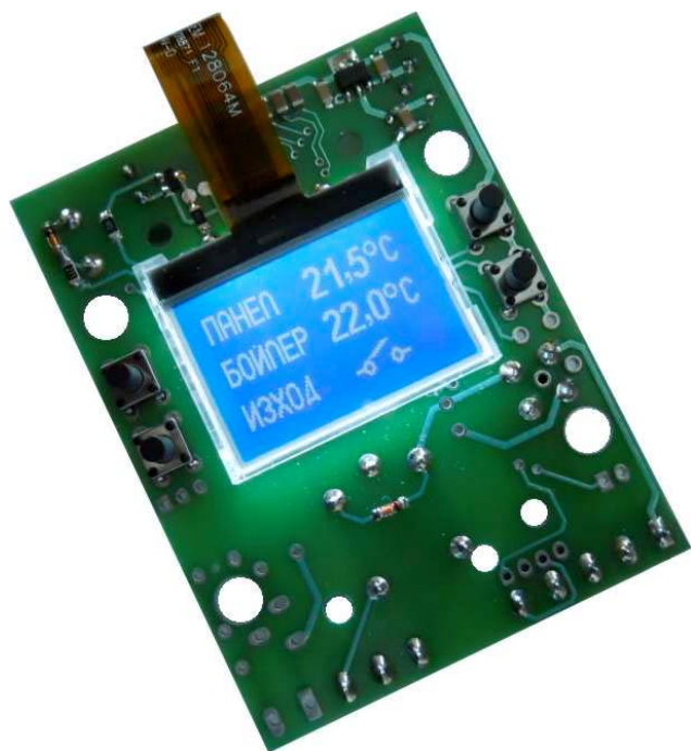
Фиг. 1 RTh9 LCD Диференциален терморегулатор